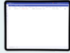
Nykyisten hälytysten luettelonäkymä