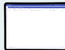
Vista dell'elenco degli allarmi correnti