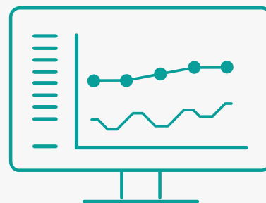
Tableau de bord statistique

Les paramètres vitaux de chaque patient sont classés par catégorie et peuvent être filtrés par plages horaires. Les données peuvent être affichées sous forme de tendances graphiques et de tableaux. Ces ressources peuvent être utiles aux médecins, en leur permettant d'observer facilement les données et les tendances enregistrées sur une période de temps. Smart Central offre la flexibilité nécessaire pour prendre en compte différentes plages horaires et des données issues d'un ou de plusieurs dispositifs. Le filtre permet aux médecins de supprimer les informations non pertinentes, afin qu'ils puissent se concentrer sur l'essentiel. L'utilisation de cette fonction fait appel au jugement de chaque médecin, qui décide des données pertinentes à inclure pour chaque patient.