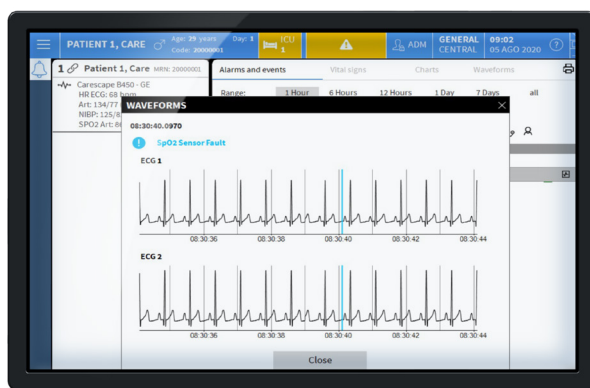
Aperçus des waveforms sur Smart Central

La possibilité de visualiser ces informations à distance et quasi en temps réel aide à optimiser les soins lorsque les collègues doivent se coordonner, à évaluer l'état des patients et à décider de la meilleure marche à suivre. En outre, le relevé automatique et la synchronisation des instantanés des waveforms avec les événements permettent d'enrichir les alertes de renseignements contextuels précieux, ce qui facilite la gestion des alarmes.