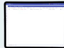
Vista elenco degli allarmi correnti